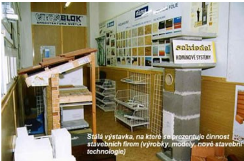
Stálá výstavka, na které se prezentuje činnost stavebních firem (výrobky, modely, nové stavební technologie)